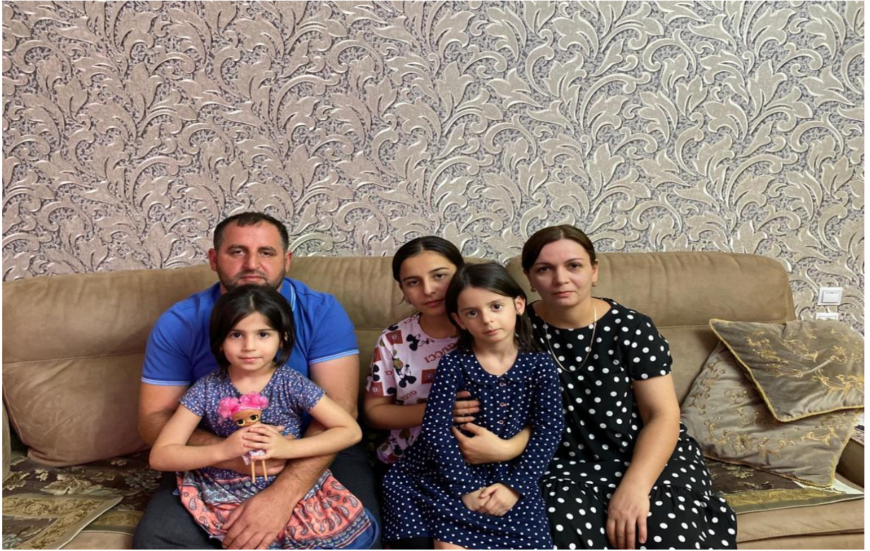
Я и моя семья