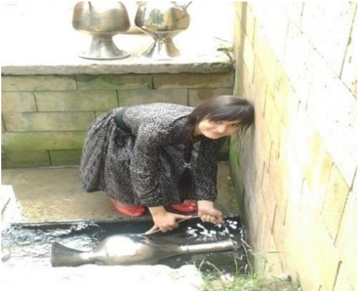
Невеста за водой